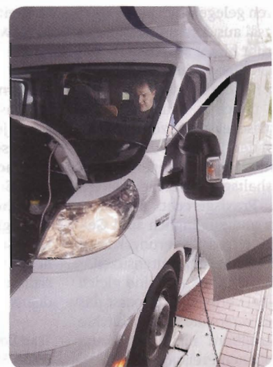
Von der Rolle: Auf dem Leistungsprüfstand schlug die Stunde der Wahrheit.

Die für die Neuprogrammierung notwendigen Informationen ermittelte Tec-Power in einer einmonatigen Entwicklungsphase individuell für jeden Motorentyp. Die modifizierten Kennfelder sind dabei so mit der vorhandenen Programmstruktur des Steuergerätes verwoben, dass sie selbst