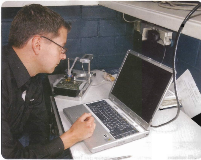
Denkzentrale: Zur Neuprogrammierung wird das Steuergerät geöffnet. Das Chip-Tuning ist für die Motordiagnosegeräte der Fahrzeughersteller unsichtbar.

man übrigens nicht unbedingt vor Ort sein muss. Man kann auch nur das Steuergerät einschicken und erhält es dann samt einem individuell auf das Fahrzeug ausgestellten Gutachten zum Eintrag der Leistungssteigerung in die Fahrzeugpa-